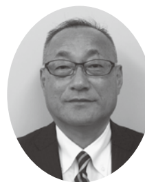
議長 丹野 政喜