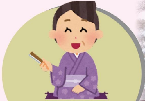
昔ばなし (名取昔ばなし語りの会)