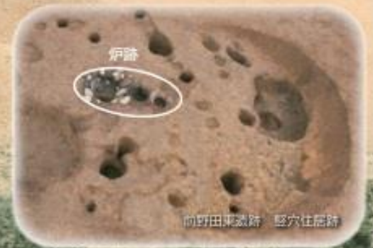
向野田集落跡 竪穴住居跡

約6,000年前の名取に暮らし縄文人は、大規模なムラをつくり、食料資源の豊富な森とともに生活していました。今回の企画展では、名取市内外の代表的な縄文ムラや、縄文人が森とどう関わりながら暮らしていたかを紹介します。