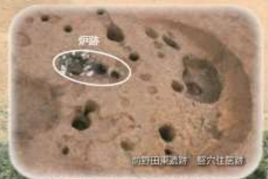
前野田東遺跡 竪穴住居跡

約6,000年前の名取に暮らし縄文人は、大規模なムラをつくり、食料資源の豊富な森とともに生活していました。今回の企画展では、名取市内外の代表的な縄文ムラや、縄文人が森とどう関わりながら暮らしていたかを紹介します。