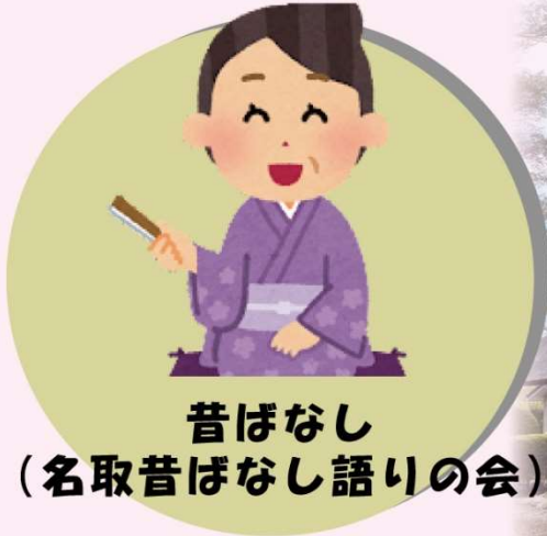
昔ばなし (名取昔ばなし語りの会)