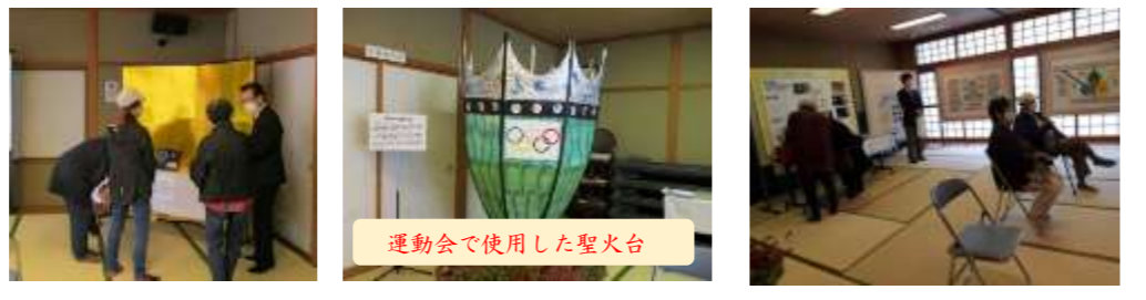
運動会で使用した聖火台