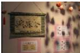
織縴会那智が丘ちりめんサークル