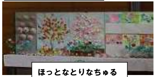
ほっとなとりなちゆる