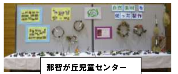
那智が丘児童センター