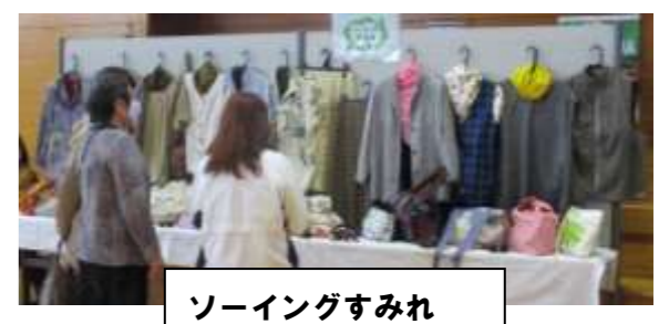
ソーイングすみれ