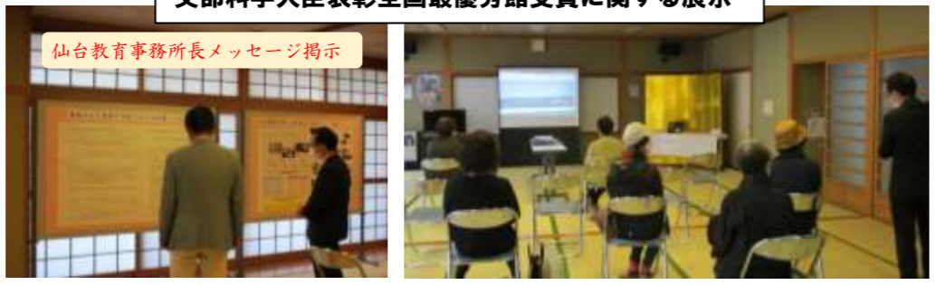
仙台教育事務所長メッセージ掲示