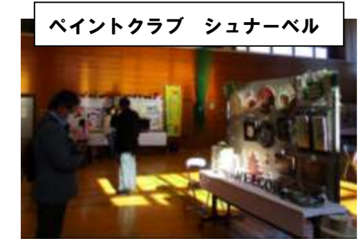
ペイントクラブ シュナーベル