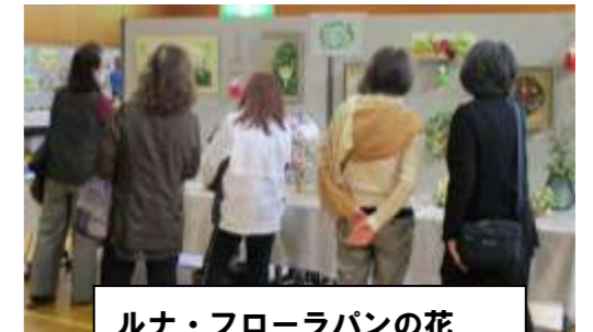
ルナ・フローラパンの花