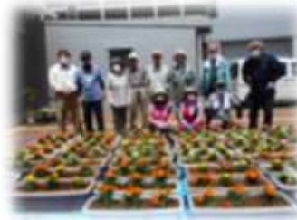
汗ばむほどの好天の下作業、お疲れ様でした。