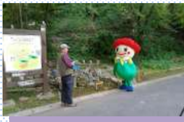
馬場区長さんから記念メダルをもらい嬉しそう!