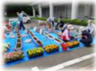
3密を避け、人数を絞って一つ一つ丁寧に植えました

今年の花は、マリーゴールドやペゴニア。プランターには、昨年度の公民館講座「資源を大切にしよう」で作り始めた腐葉土を肥料に混ぜて使用しました。その効果も期待しつつ、綺麗に咲き続けてくれることを願っています。