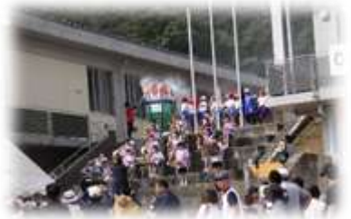
【昨年度開会式の一コマ】

令和2年10月17日(土)に開催を予定しておりました那智が丘地区大運動会は、新型コロナウイルス感染拡大防止のため中止となりました。楽しみにされていた聖火リレーも次回へ持ち越しとなります。色々なアイデア・ご意見をいただき、次回の運動会で実現できるよう、ご協力をお願いします。