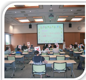
Kids サマースクール小学生

※2 セミナーの内容は、予定の時間内で終了可能な内容をご相談させていただきます。