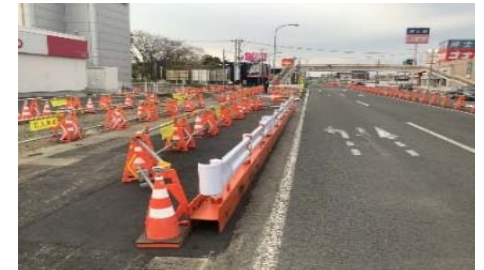
(*夜間の通行規制時に一時的に歩道部の走行をしていただきます)