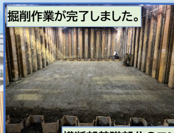
掘削作業が完了しました。