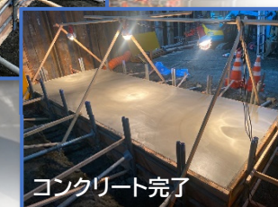
コンクリート完了

実際に設置するコンクリート2次製品です。これを並べて設置し連結して地下歩道にしていきます。（プレキャストボックスカルバートと言います。）