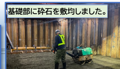
基礎部に砕石を敷均しました。