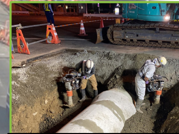
東側の横断管渠φ1000の施工を行いました。

鋼矢板を引抜くと地面の中に小さな隙間が出来ます。その隙間に特殊材料を充填することで、地表の沈下や陥没を防ぎ、車道路面の安全を確保します。特殊な材料が地表にあふれてきて、十分に充填がされていることが確認できます。