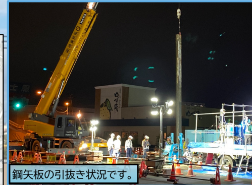
鋼矢板の引抜き状況です。