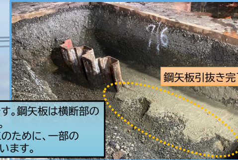
鋼矢板引抜き完了

鋼矢板引抜き完了です。鋼矢板は横断部の一部を引抜きました。東西の階段部の施工のために、一部の鋼矢板はまだ残っています。