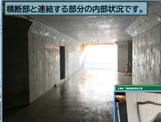
横断面と連結する部分の内部状況です。