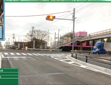
交差点改良箇所の工事が完了しました。