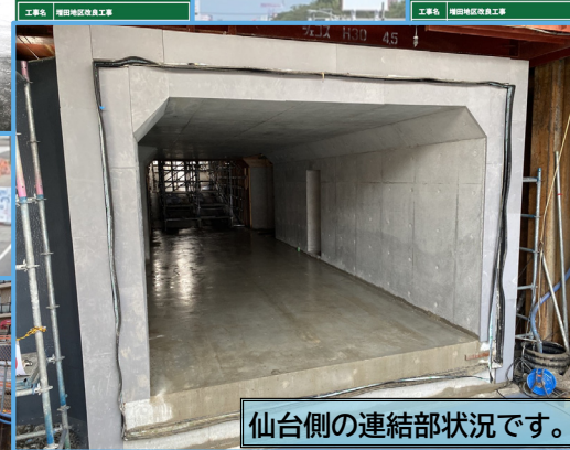
仙台側の連結部状況です。