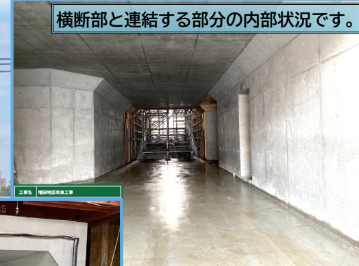
横断面と連結する部分の内部状況です。