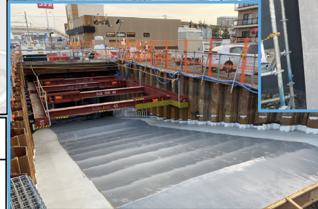
仙台側出入口部の下部防水まで完了しています。