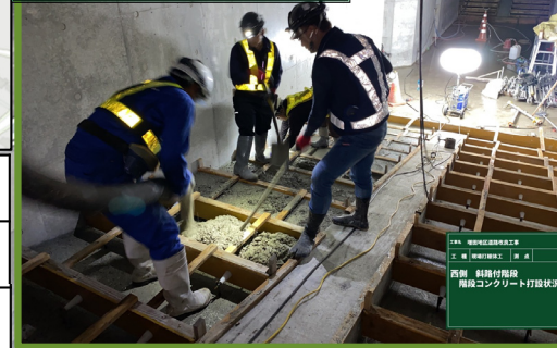
西側 階段付階段 階段コンクリート打設状況