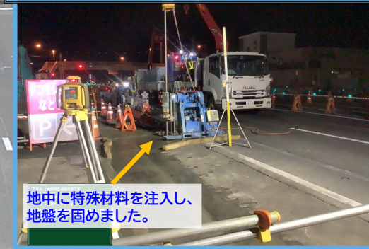
地中に特殊材料を注入し、地盤を固めました。