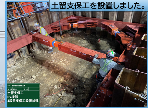
土留支保工を設置しました。