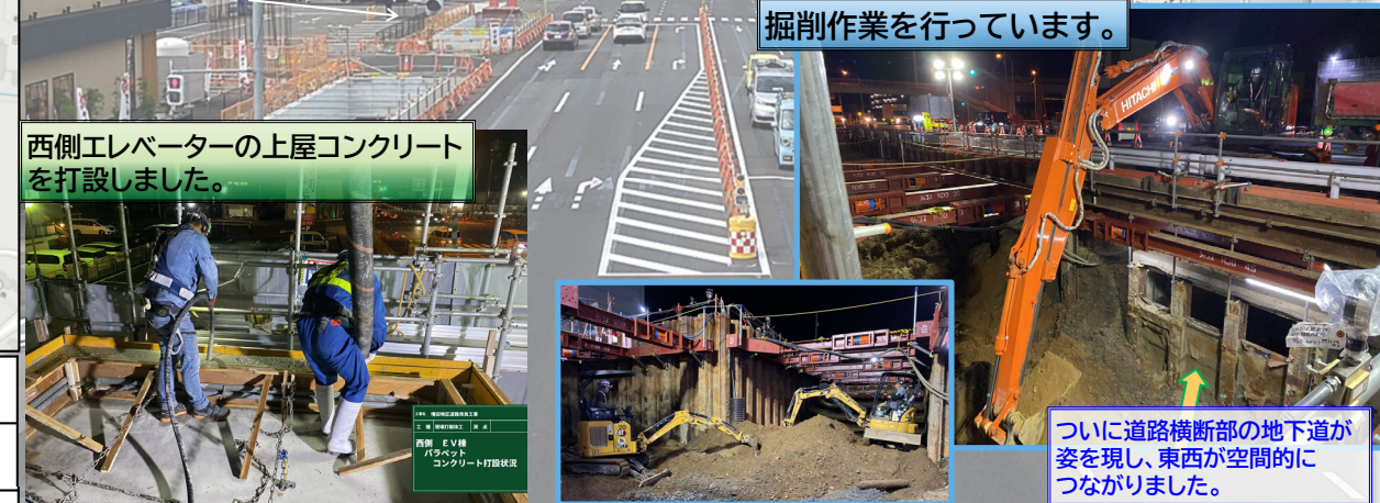
掘削作業を行っています。