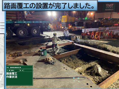
路面覆工の設置が完了しました。