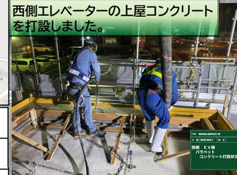
西側エレベーターの上屋コンクリートを打設しました。