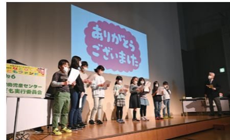
希望のたねde賞 下増田児童センター子ども実行委員会