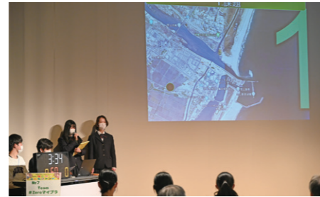
なとりde賞 農業経営者クラブTeam#Zeroマイプラ