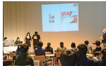
元気de賞 農業経営者クラブTeam名取一番