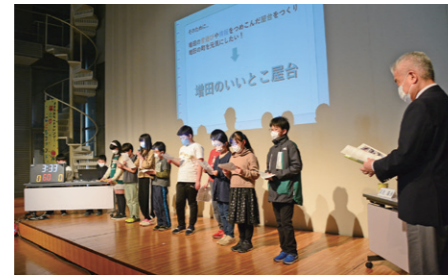
希望のたねde賞 増田子ども遊びクラブ