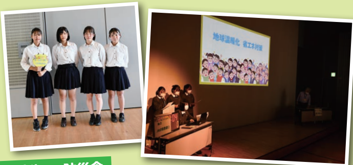
高校生 × 防災食

昨年度に引き続き、非常食として備蓄されている食材を使った防災食レシピを作り、ポスターに掲載する。 また小学校へ出向いて防災食の出前授業を行いたい。