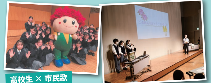
高校生 × 市民歌

昨年度に引き続き、名取市民歌とともに、名取市の魅力を広める動画を制作する。 高齢者を中心に幅広い年齢層に見てもらえるような魅力発信動画を制作したい。