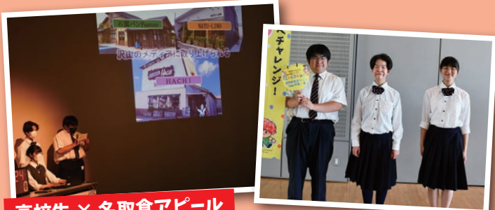
高校生 × 名取食アピール

名取市内の食材を使用したレシピを作り、様々な大会に挑戦して全国1位を目指す。 多くの人に注目され、名取産の食の魅力に気づいてもらえるよう全国大会商品としてアピールしたい。