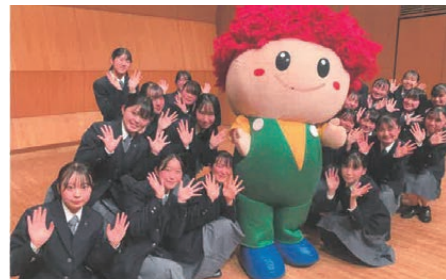
なとりde賞 名取北高等学校 吹奏楽部