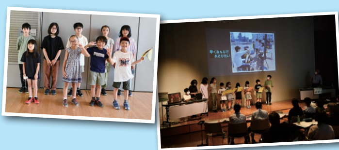
小学生・中学生 × ゲーム大会

まだ大勢集まって遊ぶことが難しい状況なので、各児童センターを会場に離れた場所でも皆で楽しめるゲーム大会を行いたい。