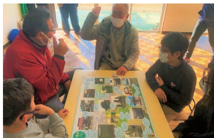
元気de賞 下増田児童センター 子ども実行委員会