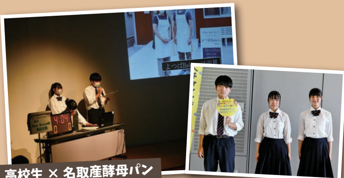
高校生 × 名取産酵母パン

名取産の食材を使用した天然酵母を作り、その天然酵母を使ったパンを作る。名取産天然酵母のパンを多くの人に知ってもらいたい。