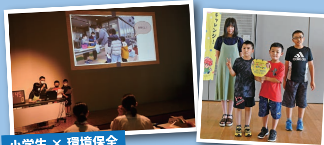
小学生 × 環境保全

地元の閑上がきれいで、住みやすい町になってほしいという思いから、閑上のゴミをゼロにするため、地域の方と一緒にゴミ拾いを行う。ゴミを無くし閑上がきれいにし、さらに地域住民との交流も深めたい。