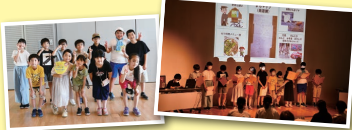
小学生 × 名取のいいところ

増田のいいところを取材し、まちしんぶん・紙芝居などを作る。さらに増田のいいところを詰め込んだ屋台を作り、地元のイベントに出店する。 たくさんの人に名取市や増田のことを知ってほしい。