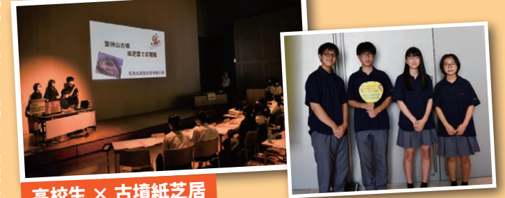
高校生 × 古墳紙芝居

雷神山古墳の歴史や文化について紙芝居を制作し、市内の児童センターで読み聞かせを行う。 雷神山古墳の歴史や文化に触れる機会をつくることで、こどもたちに興味を持ってほしい。