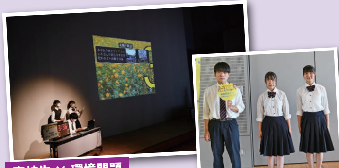
高校生 × 環境問題

マイクロプラスチックが大きな環境問題になっていることに着目して、名取の海を守るため、プラスチックを使用しない肥料を作り、商品化を目指したい。