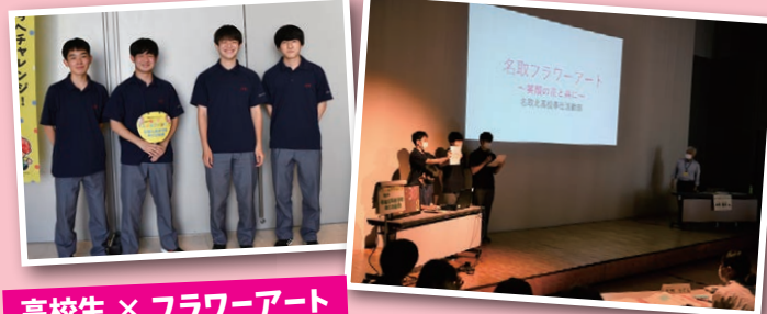
高校生 × フラワーアート

名取市の特産品であるカーネーションを使って、カーナクんのフラワーアートを作り、魅力を広めたい。 さらにフラワーアートで使った花を、アレンジメントして市内公共施設等に配布し市民の方が見る機会を作りたい。