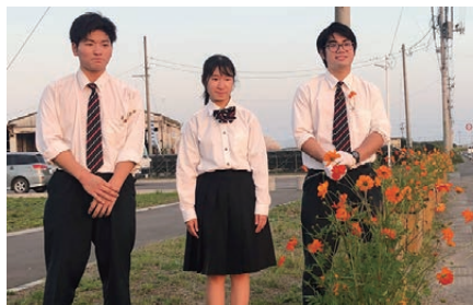
希望のたねde賞 Teamオレンジ