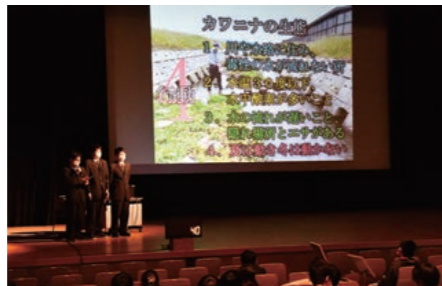
🏆 希望のたわde賞 宮城県農業高等学校 作物類型班