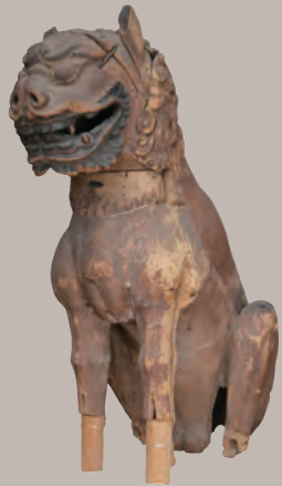
熊野神社所蔵の 木造獅子(狛犬) (鎌倉時代初期か)