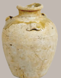
熊野那智神社経塚群から 出土した古瀬戸の三耳壺 (鎌倉時代後期か)